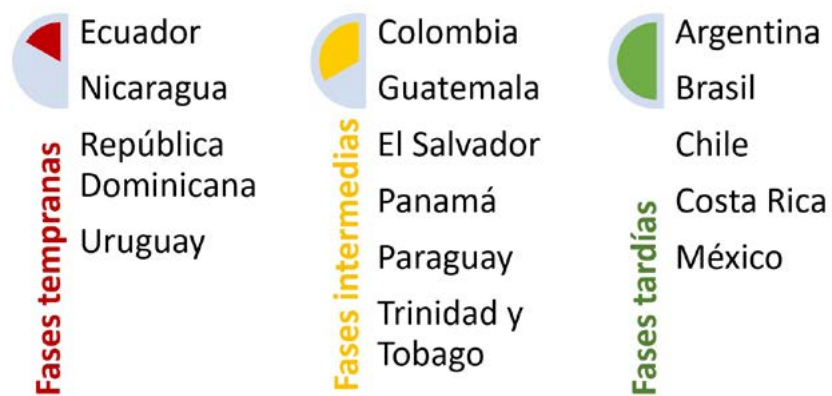
Figura 1. Priorización de personal docente y no docente de educación inicial, primaria y secundaria en los planes de vacunación

a otras personas con sus mismas características demográficas. La priorización del personal docente y no docente en las escuelas, es muy importante para ayudar a acelerar el retorno seguro a las clases presenciales en la región, cuya suspensión ha afectado a 165 millones de estudiantes. 50 La crisis mostró, una vez más, algunas de las desigualdades estructurales: el 46% de los niños y niñas (de 5 a 12 años) no tiene acceso a Internet en casa y no todos los estudiantes tienen las mismas habilidades digitales y capacidades para el e-learning. 51 La evidencia ya muestra que en 2020 las dificultades de lectura de los niños y niñas aumentaron,